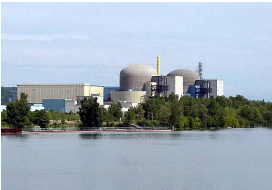
Photographie du site de Saint-Alban/Saint-Maurice

En 2011, les deux unités de production de la centrale nucléaire de Saint-Alban/Saint-Maurice ont produit 16,1 TWh. Cela représente cinq fois la consommation annuelle d'électricité d'une ville comme Lyon et 30% des besoins en énergie électrique de la région Rhône-Alpes (référence [8]).