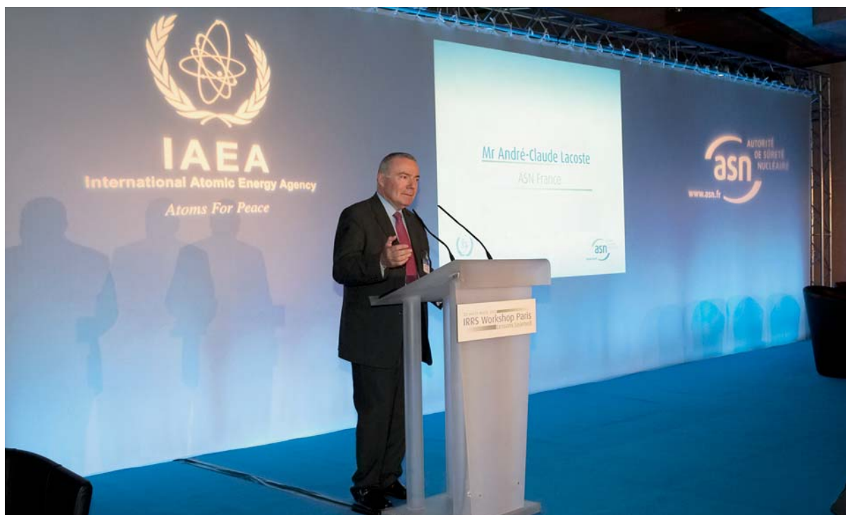
IRRS Workshop Paris – Intervention de M. André-Claude Lacoste, président de l'ASN

L'Agence pour l'énergie nucléaire (AEN) de l'OCDE assure, quant à elle, le secrétariat de la phase 2 du programme multinational d'évaluation de la conception des réacteurs nucléaires (MDEP – Multinational Design Evaluation Programme ). Ce programme, qui rassemble les principaux pays nucléaires de l'OCDE, vise à développer des procédures innovantes de mise en commun des ressources et connaissances des Autorités de sûreté nationales chargées de l'examen des nouvelles conceptions de centrales. La première phase de ce programme, qui en comporte trois, concerne les réacteurs dont la conception est soumise à la certification de l'Autorité de sûreté américaine (NRC) et qui sont en cours d'instruction par d'autres Autorités de sûreté nucléaire. Pour l'heure, seul l'EPR est concerné et fait l'objet d'une coopération entre l'ASN et l'Autorité de sûreté finlandaise (STUK),