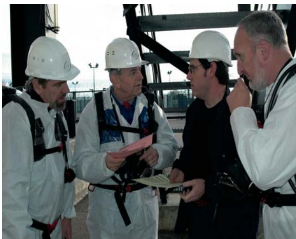
Inspection de l'ASN à la centrale nucléaire de Belleville-sur-Loire (Cher)

L'ASN consacre une part importante et croissante de son action de contrôle aux questions liées aux facteurs organisationnels et humains (FOH). Le contrôle porte sur toutes les conditions, en matière d'efficacité et de sûreté, de l'intervention humaine. Dans ce cadre, les organisations ont un rôle