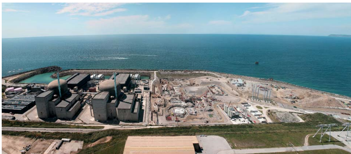
Centrale nucléaire de Flamanville dans la Manche

Le réacteur EPR ( European Pressurized water Reactor ) est un réacteur électronucléaire pouvant délivrer une puissance de l'ordre de 1600 mégawatts. Pour cette nouvelle génération de