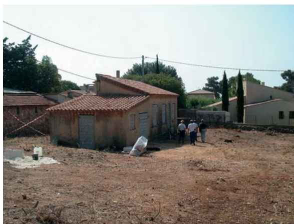
Réhabilitation du site de la propriété Danne à Bandol (Var)

taires doivent procéder notamment à un contrôle des terres excavées en cas de travaux d'agrandissement de leur habitat ou de réalisation de piscine. Au préalable, l'ASN avait proposé l'instauration de ces périmètres au préfet de l'Essonne.