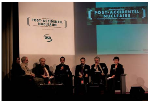
Séminaire international sur le thème de la gestion post-accidentelle des 6 et 7 décembre 2007 à Paris

Ce comité a été mis en place le 24 juin 2005, il est composé de représentants de l'ASN, de l'IRSN, du SGDN, des ministères chargés de l'agriculture et de la pêche, du budget, de la défense, de l'écologie, de la santé, de l'industrie, de l'intérieur et des agences sanitaires (AFSSA, AFSSET, InVS).