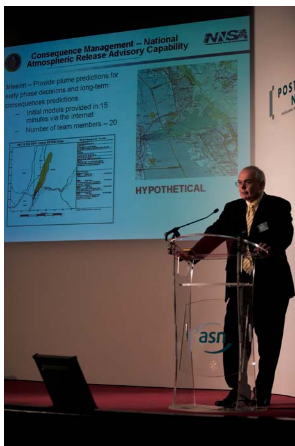
Séminaire international sur le thème de la gestion postaccidentelle des 6 et 7 décembre 2007 à Paris