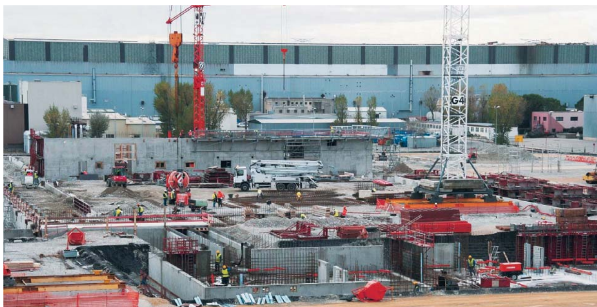
Chantier de construction de l'usine Georges Besse II

En 2007, au cours de sept inspections menées sur le chantier, l'ASN s'est focalisée sur les activités de génie civil et s'est