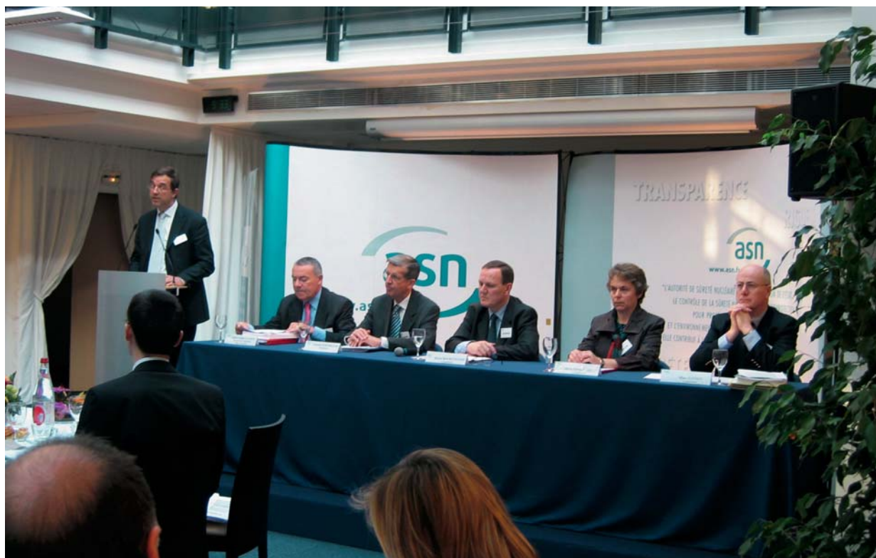
Le collège et le directeur général de l'ASN lors de la présentation du rapport 2006 à la presse

Le parc contrôlé par l'ASN est l'un des plus importants et des plus diversifiés au monde. Il regroupe notamment un ensemble standardisé de réacteurs qui participent à la production de la majorité de l'électricité consommée en France et l'ensemble des installations du cycle du combustible, mais aussi des installations de recherche et des usines quasi-unicques. L'ASN assure de plus le contrôle de plusieurs milliers d'installations ou d'activités où sont utilisées des sources