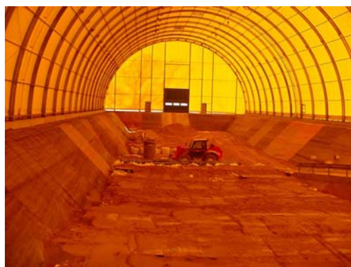
CSTFA : Intérieur d'une alvéole de stockage