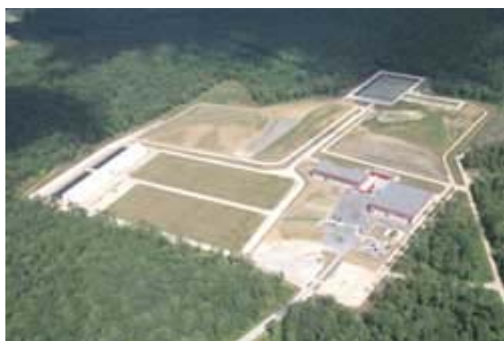
CSTFA : vue aérienne du Centre

Ce centre est unique au monde : jusqu'à présent, seule la France a fait le choix de créer une filière spécifique à ce type de déchets.