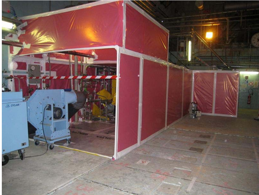
Sas en cours de montage pour un chantier du démantèlement dans la caverne « combustible »

La centrale nucléaire des Ardennes a cessé définitivement toute production électrique le 30 octobre 1991. Un décret du 19 mars 1999 a autorisé la modification de l'installation pour la transformer en installation d'entreposage de ses propres matériels. Compte tenu du changement de sa stratégie de démantèlement, EDF a déposé le 30 novembre 2004, auprès de l'ASN, une demande d'autorisation de mise à l'arrêt définitif et de démantèlement complet de l'installation. L'instruction de la demande a abouti à la signature du décret n° 2007-1395 du 27 septembre 2007 autorisant EDF à procéder à ces opérations. Ce décret stipule que le démantèlement de l'installation doit être réalisé dans les quarante ans à compter de sa date de publication (JO du 29 septembre 2007).