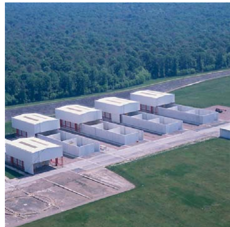
CSFMA : ouvrages de stockage des déchets