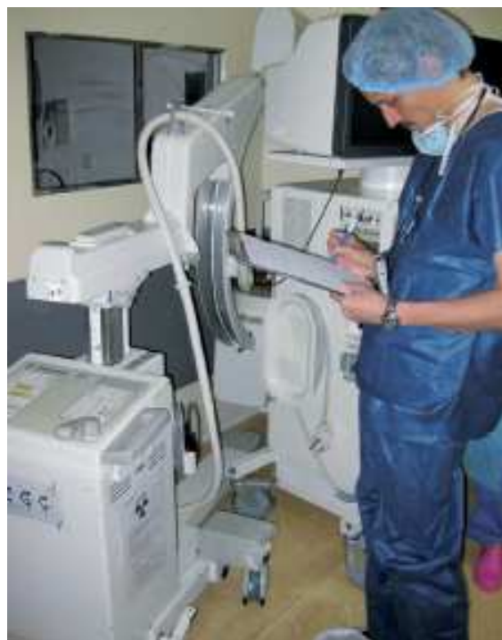
Inspection dans un service de radiologie interventionnelle

En 2011, une action importante de contrôle portant sur les conditions d'utilisation des scanners sera réalisée.