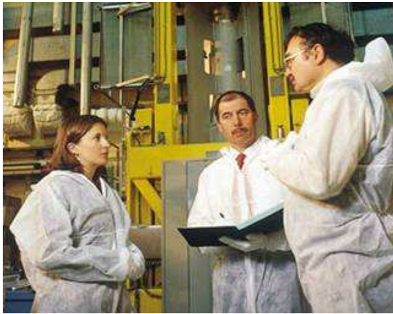
Une inspection sur les équipements sous pression

nécessité de véhiculer des quantités importantes de vapeur ou d'eau pressurisée conduit à une quantité considérable d'équipements sous pression. Par l'énergie qu'ils sont susceptibles de libérer en cas de défaillance (fissuration, explosion, etc.), ces équipements présentent des risques qu'il convient de maîtriser. De ce fait, ils sont soumis à une réglementation stricte en vue d'assurer leur sécurité. Les équipements sous pression susceptibles d'émettre des rejets radioactifs en cas de défaillance sont appelés équipements sous pression nucléaires.