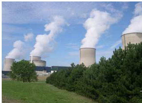
La centrale nucléaire de Cattenom

Ayant constaté un relâchement dans le domaine de la radioprotection des travailleurs l'an passé, l'ASN avait demandé à l'exploitant d'établir un retour d'expérience précis dans ce domaine et de prendre les mesures adaptées.