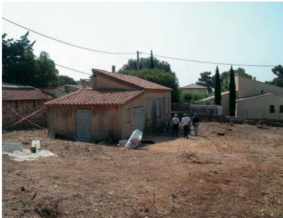
Réhabilitation du site de la propriété Danne à Bandol (Var)

taires doivent procéder notamment à un contrôle des terres excavées en cas de travaux d'agrandissement de leur habitat ou de réalisation de piscine. Au préalable, l'ASN avait proposé l'instauration de ces périmètres au préfet de l'Essonne.