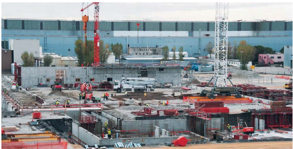
Chantier de construction de l'usine Georges Besse II

En 2007, au cours de sept inspections menées sur le chantier, l'ASN s'est focalisée sur les activités de génie civil et s'est