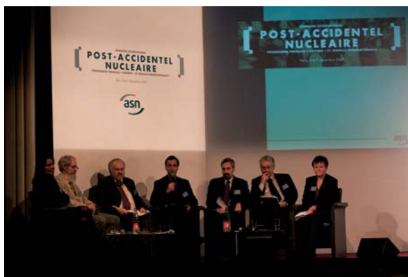
Séminaire international sur le thème de la gestion post-accidentelle des 6 et 7 décembre 2007 à Paris

Ce comité a été mis en place le 24 juin 2005, il est composé de représentants de l'ASN, de l'IRSN, du SGDN, des ministères chargés de l'agriculture et de la pêche, du budget, de la défense, de l'écologie, de la santé, de l'industrie, de l'intérieur et des agences sanitaires (AFSSA, AFSSET, InVS).