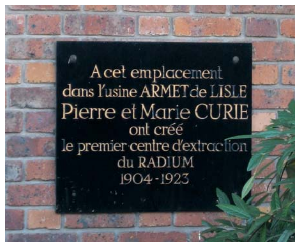
Ancienne école Pierre et Marie Curie à Nogent-sur-Marne (Val-de-Marne)

D'après la circulaire interministérielle de 1997 (disponible sur le site www.sites-pollues.ecologie.gouv.fr ), un site pollué par des substances radioactives est un site, abandonné ou en exploitation, sur lequel des substances radioactives, naturelles ou artificielles, ont été ou sont mises en œuvre ou entreposées dans des conditions telles que le site présente des risques pour la santé et l'environnement. Cette circulaire, destinée aux préfets, décrit la procédure administrative applicable aux sites pollués par des substances radioactives et précise que les opérations de traitement et de réhabilitation sont réalisées et financées directement par les responsables, tels que définis par la loi du 19 juillet 1976 relative aux installations classées pour la protection de l'environnement.