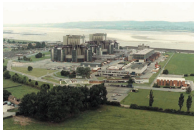
Réacteur MAGNOX de Berkeley – état initial

Trois sites de réacteurs « Magnox » sont en cours de démantèlement au Royaume-Uni. Ils se trouvent à Berkeley, en Angleterre, à Trawsfynydd, au Pays de Galles, et à Hunterston A, en Ecosse. Le propriétaire et exploitant des trois sites est BNFL. En 1989, Berkeley a été le premier réacteur de production à être mis à l'arrêt au Royaume-Uni, suivi de Hunterston A en 1990 et de Trawsfynydd en 1993. Le combustible a été déchargé et envoyé à Sellafield aux fins de retraitement. Deux autres centrales nucléaires de type « Magnox », à Hinkley Point A et Bradwell, ont été mises à l'arrêt et le déchargement du combustible est en cours. Ces