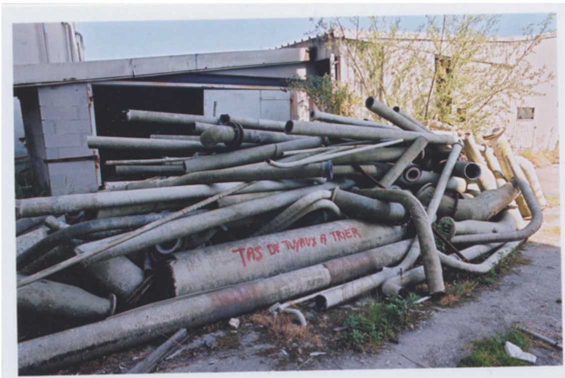
Usine d'engrais de Grand Couronne

A Thann, en Alsace, 360 tonnes de déchets de thorium et de radium sont entreposées dans un hangar annexe de Millenium Chemicals, ex Rhône-Poulenc, qui fabrique de l'oxyde de titane à partir du minerai d'ilménite comportant des traces d'éléments radioactifs. Plusieurs fûts ont été récupérés dans la décharge de classe 2 de Retzwiller. Au Havre, l'autre usine du groupe Millenium Chemicals ne génère pas offi-