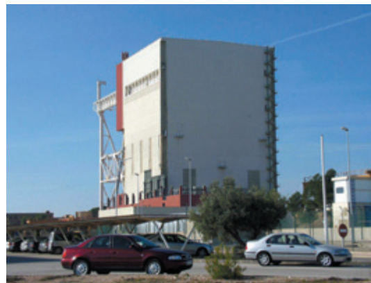
Le réacteur Vandellós I