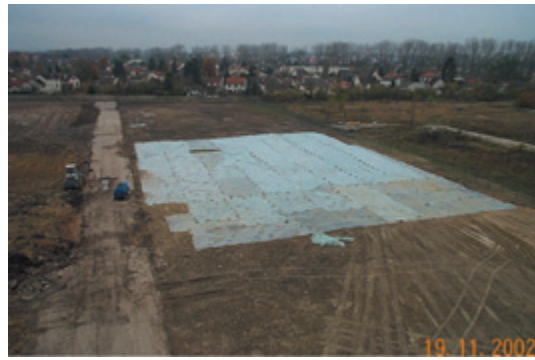
Mise en place d'un film polyane sur une zone polluée à l'ouest du site

liers, le trafic des camions est assuré entre 7h30 et 16h30.