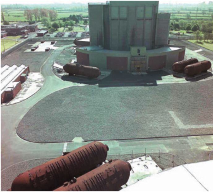
Réacteur MAGNOX de Berkeley – état d'entreposage sûr

deux sites sont exploités par Magnox Electric plc, filiale à 100 % de BNFL.