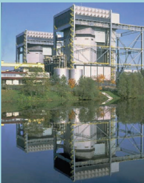
les réacteurs UNGG de Saint-Laurent A

Aujourd'hui, toute la partie secondaire a disparu ainsi que des bâtiments annexes et des lignes électriques jusqu'au poste de transformation. Il reste en place, sous les structures qui les abritent, deux très volumineux caissons en béton qui contiennent les cœurs des réacteurs vides de combustible nucléaire (phase 1), mais occupés par plusieurs milliers de tonnes d'empilements de graphite irradié et les auxiliaires nucléaires adjacents.