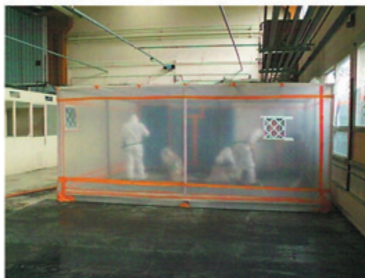
Cloche de désamiantage

De mi-juillet à octobre 2002, des travaux de désamiantage des bâtiments encore en place (dont certains en ruines) sont réalisés. Les sociétés Hanny et Cherpin, spécialistes de cette