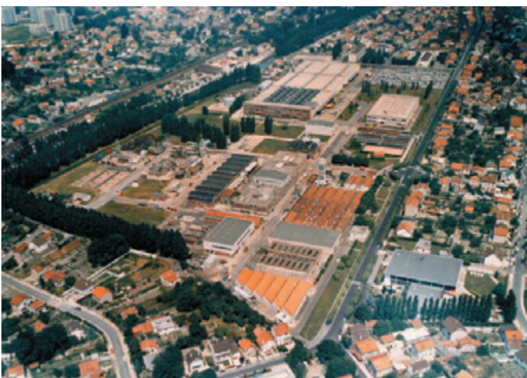
Vue aérienne du site dans les années 1970

Pour répondre à l'arrêté préfectoral, Kodak lance avec la société Gester les premières investigations et études (historique, géologique, hydrogéologique) visant à élaborer un diagnostic initial de la situation environnementale du site. Au vu des résultats, Kodak engage des études complémentaires sur les sols et les eaux souterraines qu'elle confie également à Gester.