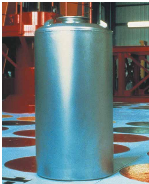
Colis de déchets de haute activité à vie longue destiné à être entreposé à COGEMA La Hague

L'article L542 prévoit que ces recherches sont réalisées sous le contrôle de la Commission nationale d'évaluation, qui établit chaque année un rapport sur l'état d'avancement des recherches. À l'issue d'un délai de 15 ans à compter du 31 décembre 1991, le gouvernement doit remettre un rapport faisant le bilan des recherches, accompagné d'un projet de loi autorisant, le cas échéant, la création d'un centre de stockage des déchets radioactifs de haute activité à vie longue et fixant le régime des servitudes et des sujétions afférentes à ce centre.