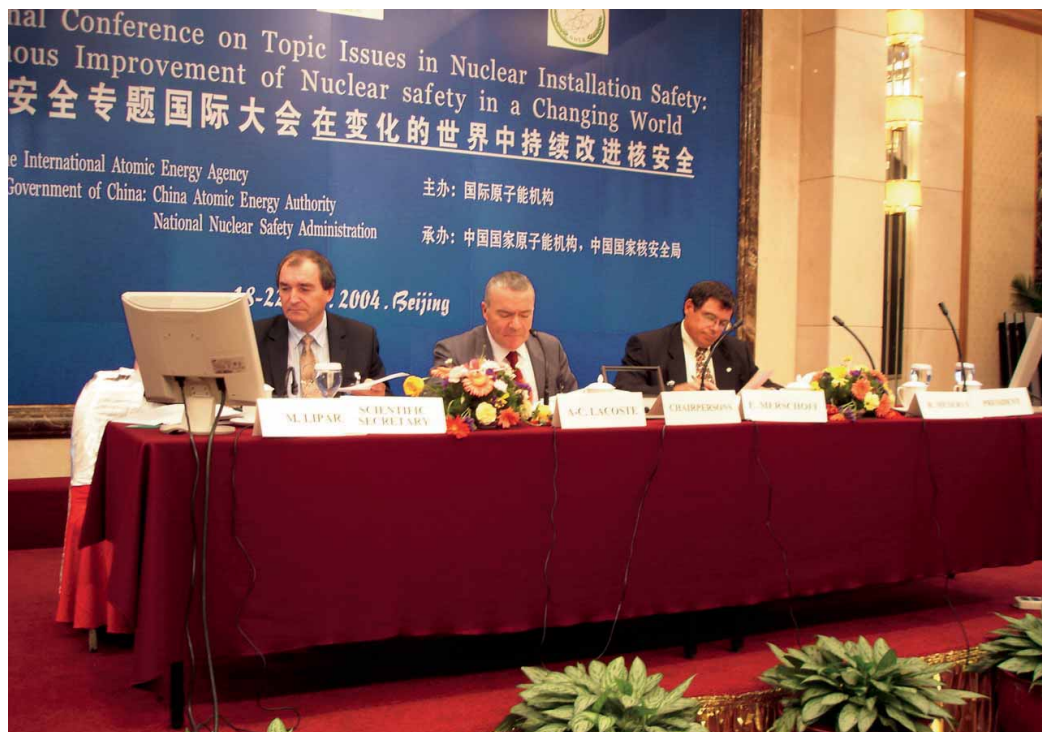
Conférence de l'Agence internationale de l'énergie atomique à Pékin

Les missions internationales de l'ASN ont été confirmées dans le décret n° 2002-255 du 22 février 2002 créant la DGSNR, qui précise notamment : « En liaison avec les services du ministre des Affaires étrangères, la Direction générale de la sûreté nucléaire et de la radioprotection prépare et propose, dans ses domaines de compétence, les positions françaises en vue des discussions internationales et communautaires ».