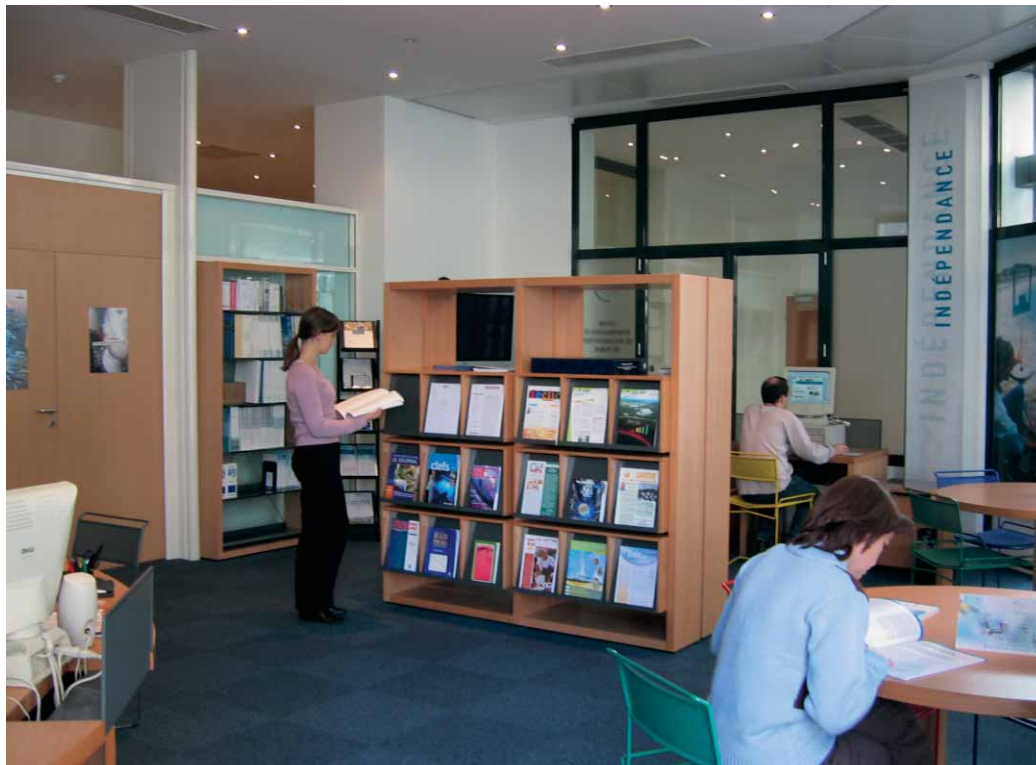
Centre d'information et de documentation du public de l'ASN

ordres professionnels, professions médicales et paramédicales, détenteurs de sources... Plus globalement, la nouvelle ASN entend bien nouer des relations fortes et sans ambiguïté avec l'ensemble des « parties prenantes » de son secteur et les associer, sous des formes adaptées en fonction des sujets, à l'élaboration de ses décisions. L'ASN souhaite développer dans son fonctionnement des méthodes inspirées de la « nouvelle gouvernance ».