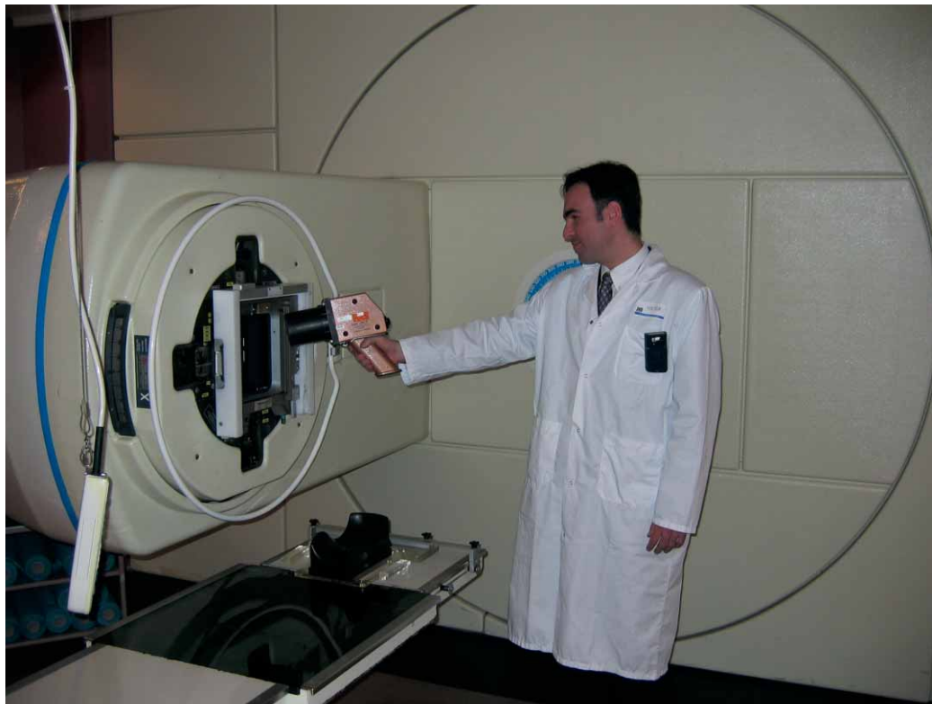
Contrôle d'un accélérateur de radiothérapie

vironnementale qui leurs sont confiées par la Direction générale de la santé. En 2005, les modalités de leur contribution au programme d'inspection de l'ASN, en ce qui concerne notamment le contrôle des organismes agréés pour la mesure du radon dans les lieux ouverts au public, seront établies.