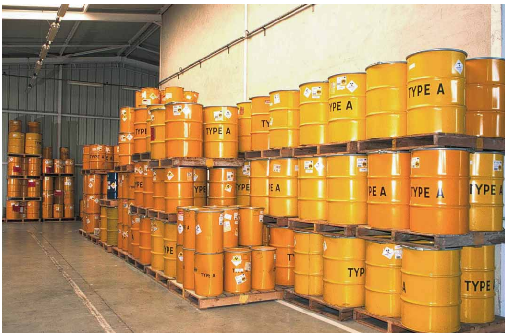
Déchets de faible activité à vie longue conditionnés en fûts métalliques au CEA de Saclay en attente de traitement