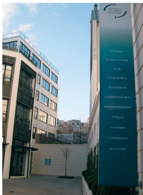
Site de l'ASN à Paris

L'ASN a toujours jugé nécessaire d'entretenir des relations avec l'ensemble des acteurs de son domaine d'activité. Pouvoirs publics, organismes de recherche, exploitants nucléaires, syndicats professionnels, CLI, associations de protection de l'environnement, sociétés savantes, au plan national comme au plan international, la « cartographie » déjà riche des organismes en relation avec l'ASN s'est accrue avec l'élargissement de ses missions à la radioprotection. L'ASN a, à ce titre, pris contact avec l'ensemble des acteurs :