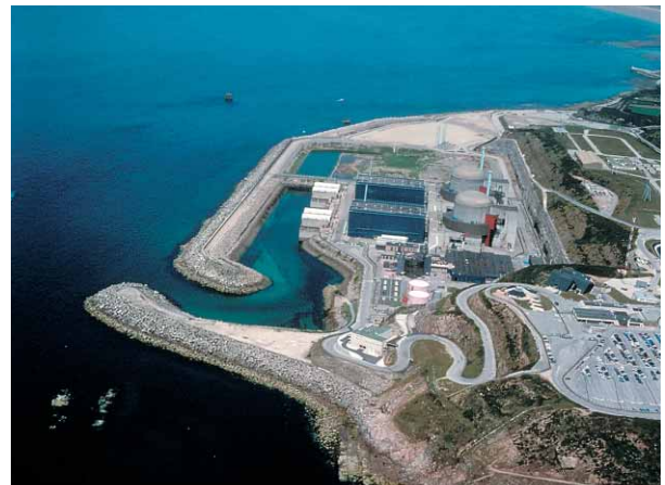
Vue aérienne du site de Flamanville

Le 21 octobre 2004, Électricité de France a annoncé avoir choisi le site de Flamanville pour un projet d'implantation d'un réacteur de type EPR. EDF a ensuite saisi la Commission nationale du débat public (CNDP), conformément aux textes réglementaires qui stipulent qu'un débat public national doit être mené sur le choix d'implantation de tous les ouvrages et infrastructures importants.