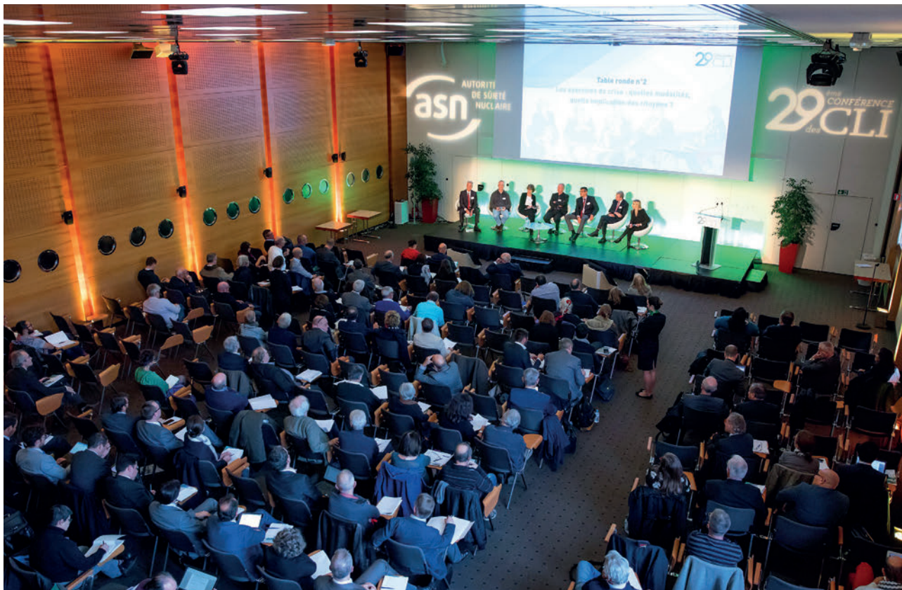
La 29 e conférence des CLI a rassemblé 260 participants, le 15 novembre 2017, à Paris, à l'initiative de l'ASN et en partenariat avec l'Ancli.

d'améliorer ces résultats afin que les CLI puissent remplir au mieux leur principale mission : l'information de la population.