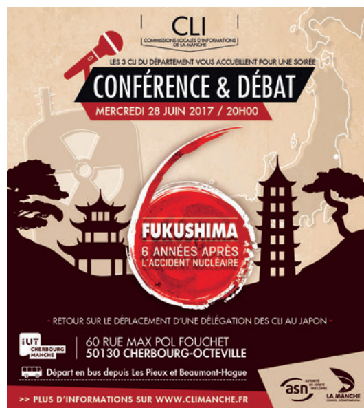
Affiche de la rencontre interCLI de Normandie : retour sur l'expérience de Fukushima six ans après.

soutien financier des CLI et de leur fédération. Dans le cadre de ses réflexions sur le financement du contrôle de la sûreté nucléaire et de la radioprotection, l'ASN a de nouveau proposé au Gouvernement la mise en œuvre du dispositif, prévu par la loi du 13 juin 2006, d'abondement du budget des CLI à statut associatif (soit une dizaine) par un prélèvement sur la taxe INB ; toutefois cette disposition n'a pas encore été mise en place.